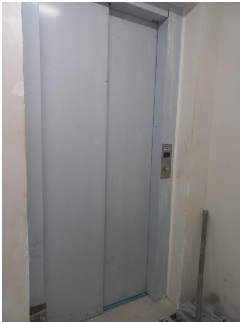
Figura 8 - Elevador