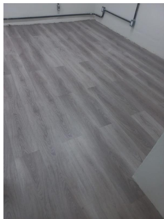
Figura 6 e 7 - Piso e Elétrica