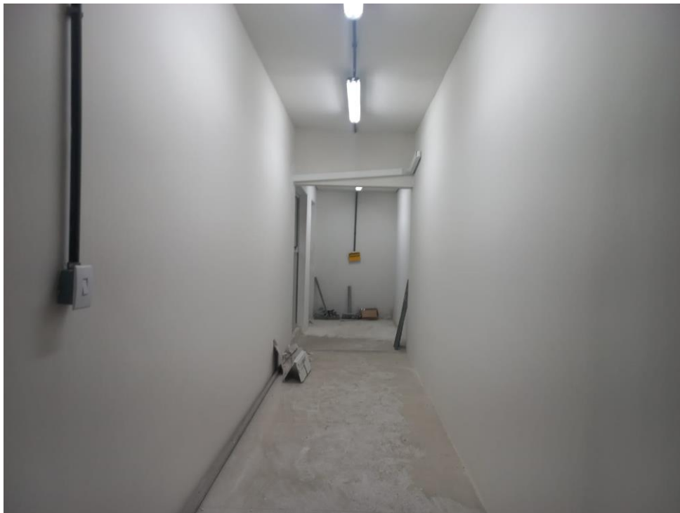
Figuras 1, 2 e 3 – Elétrica