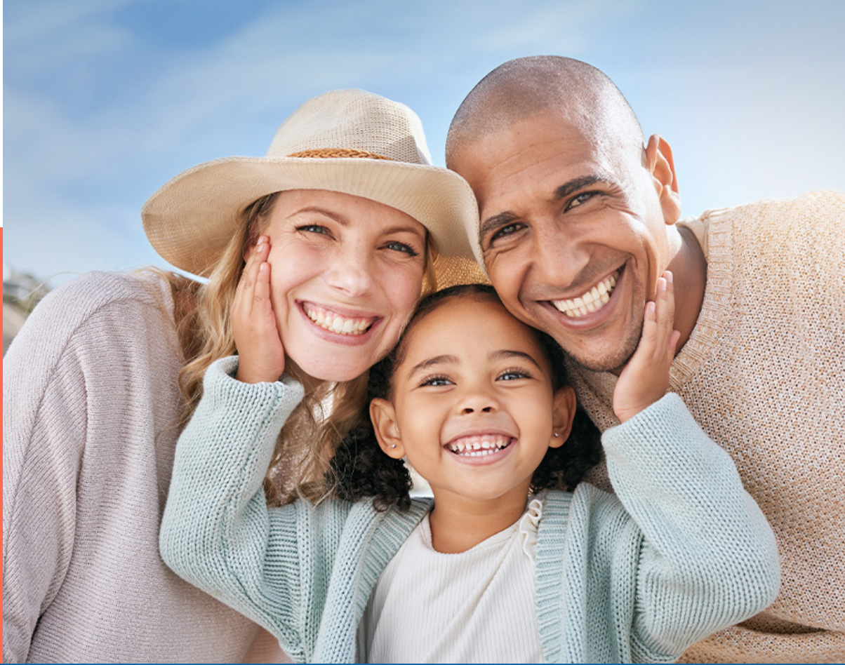
Tabela de Valores Convênio com a União