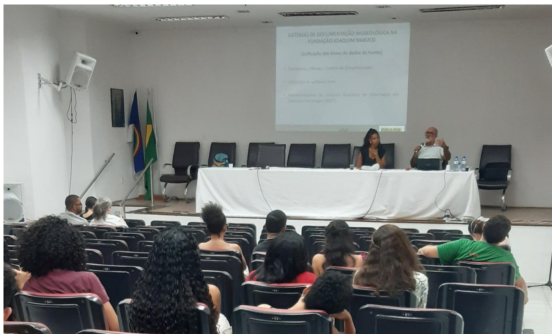
Roda de conversa “Patrimônio Cultural: Museus e Arquivos como Unidade de Informações”.

Nesse contexto, o evento se configurou como um espaço de construção coletiva e articulação política sobre patrimônio e memória, com destaque para o processo de reaproximação com a rede de museus, coleções científicas visitáveis e galerias de arte da UFPE, fortalecendo vínculos e promovendo ações estratégicas para a preservação e difusão do patrimônio institucional.