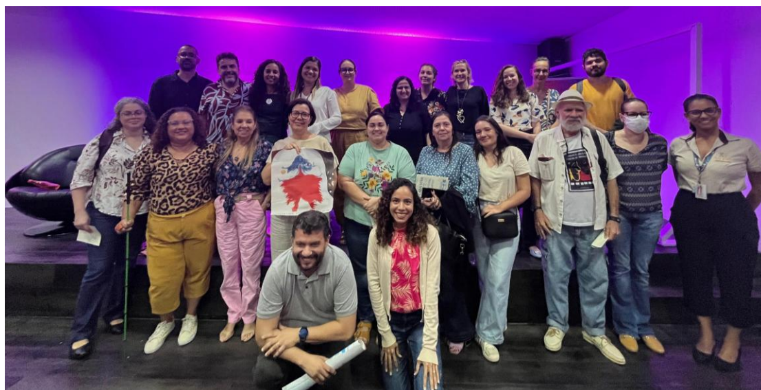
Participantes da 18ª Primavera dos Museus (2024).

Ao integrar essas discussões à programação, a iniciativa reafirmou o compromisso com a ampliação do acesso à cultura e ao conhecimento, fortalecendo o papel dos museus como espaços cada vez mais inclusivos e representativos.