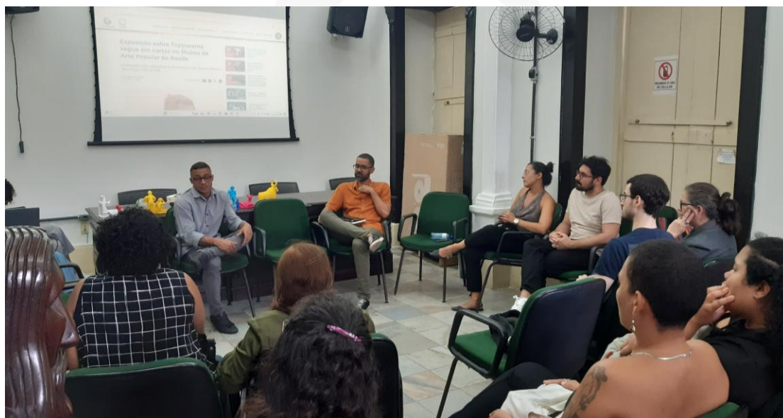
Roda de conversa “Qual curadoria queremos ? Um olhar sobre a coleção do mestre Vitalino” na Semana do Patrimônio 2024.