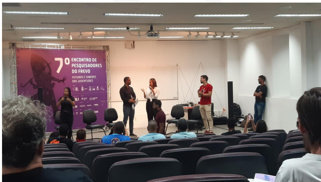
7º Encontro de Pesquisadores do Frevo, evento promovido pelo Paço do Frevo em parceria com a UFPE.