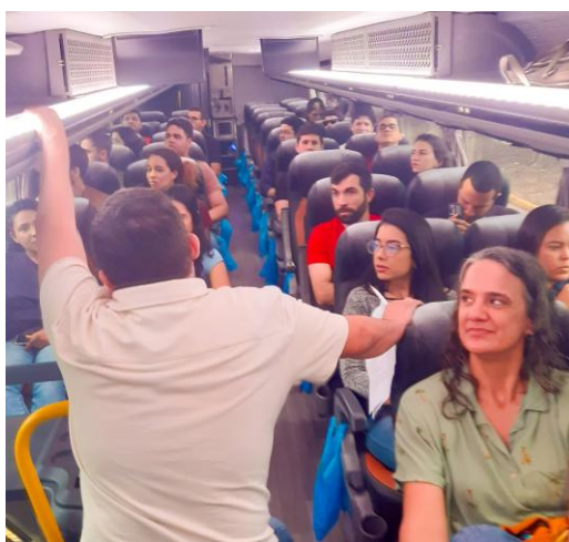
Tour Cultural pelo Campus Recife com os novos servidores.