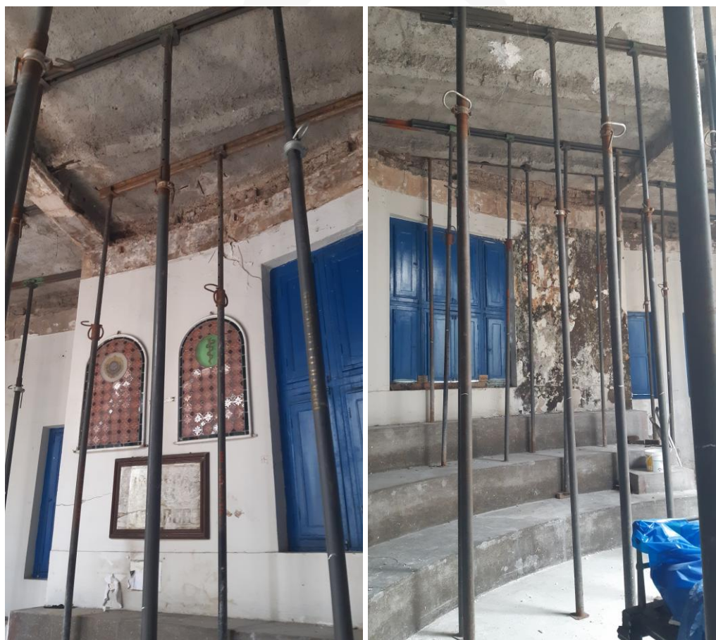
Escoramento da estrutura do Anfiteatro do Memorial da Medicina.