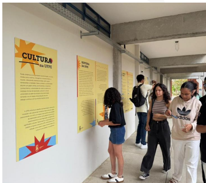
Exposição Cultura na UFPE no Bloco de Pedagogia do Centro Acadêmico do Agreste (CAA).