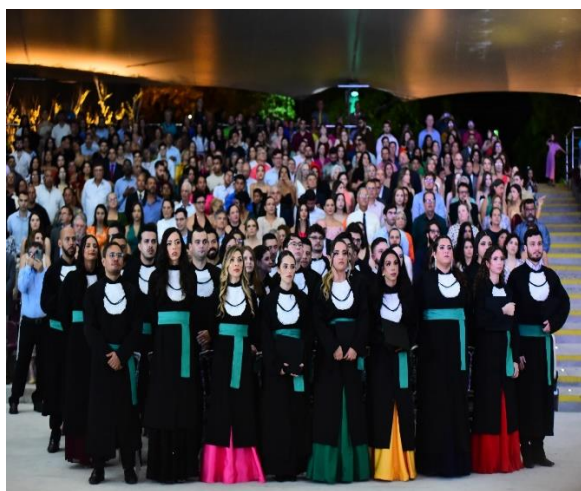
COLAÇÃO DE GRAU (2023)