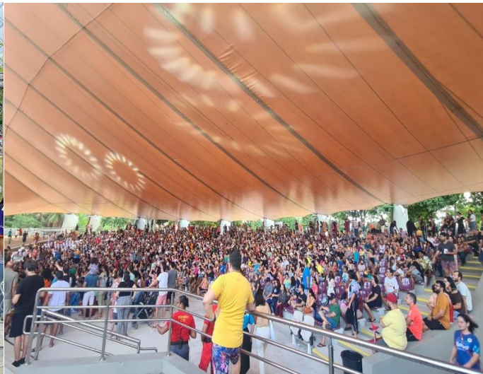
EVENTO CULTURAL (2023)

Os principais desafios para melhoria do Complexo de Convenções da UFPE podem incluir diversas estratégias visando à sua otimização e à maximização de sua contribuição para o aperfeiçoamento e qualidade na atuação da universidade, são eles: