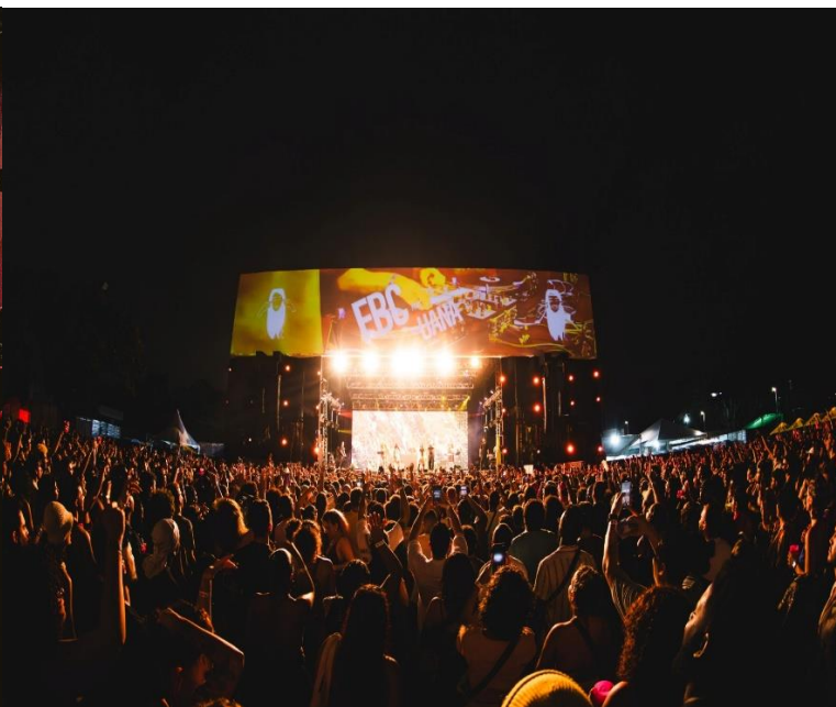
FESTIVAL CULTURAL (2023)