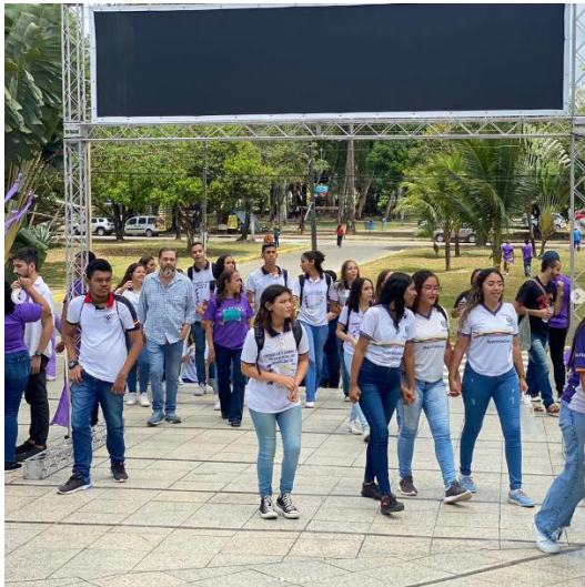
EXPO UFPE (2023)