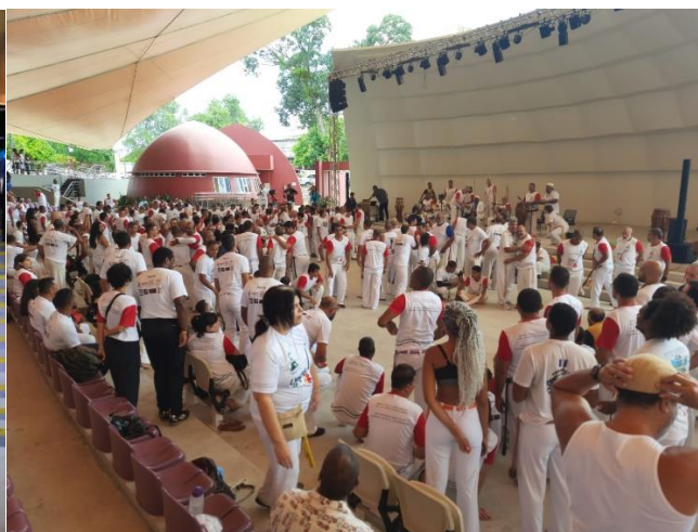
EVENTOS CULTURAIS 2023