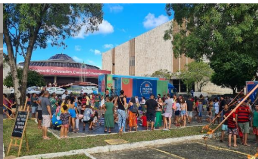
CURTA UFPE 2023