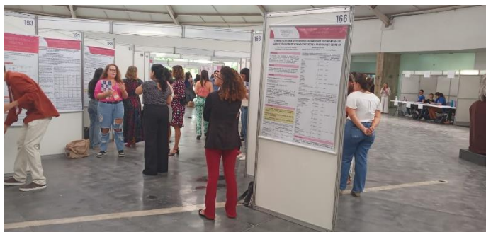
CONIC UFPE (2023)