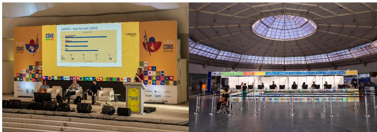
Congresso da ABRASCO 2023

Abaixo seguem fotos de alguns dos eventos que aconteceram nos Espaços do Complexo de Convenções Eventos e Entretenimento da UFPE no ano de 2023.