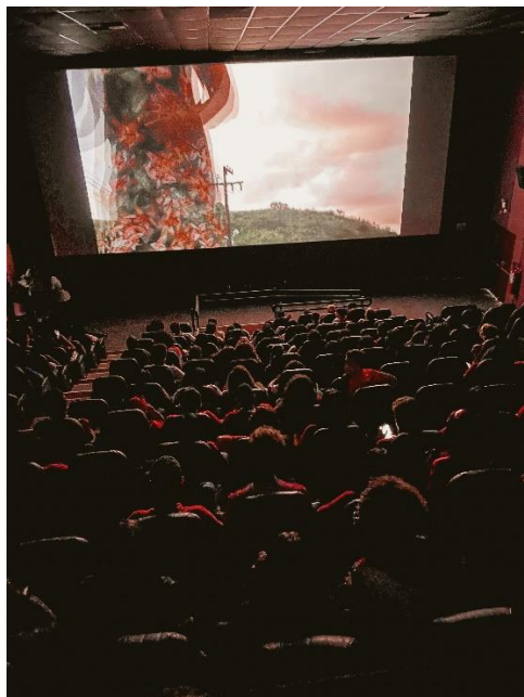
SESSÃO DE CINEMA (2023)