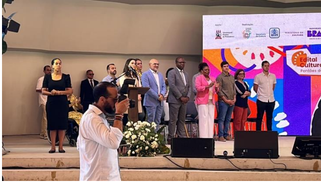
MINISTÉRIO DA CULTURA (2023)