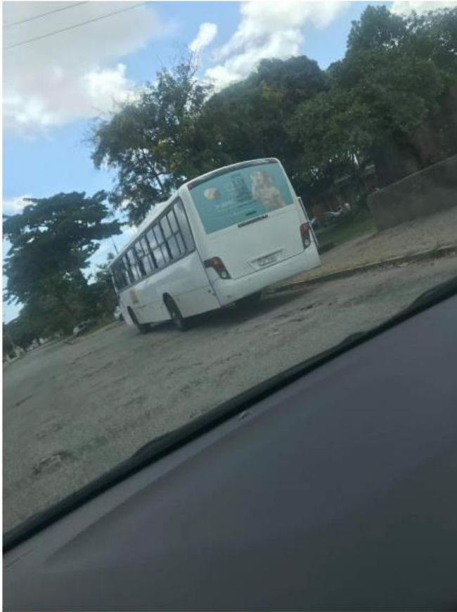
Peça de divulgação: Backbus no ônibus circular da UFPE.