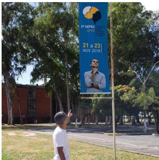
Peça de divulgação: Banner exposto no Campus Recife, nas proximidades da Biblioteca Central

sepec.ufpe Fiquem ligados! As inscrições para ouvintes na 2ª Sepec - Semana de Ensino, Pesquisa, Extensão e Cultura, já começaram. Os interessados terão do dia 05 a 12 de novembro para realizar a